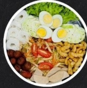
ตำถาด (ตำไทย/ตำลาร้า) Thai Papaya Salad served in tray.