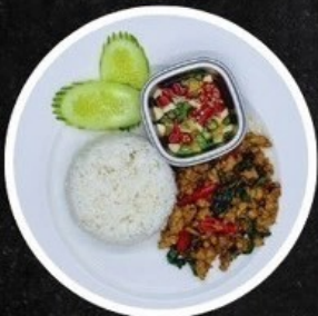
ข้าวกะเพราไก่/หมู/เนื้อ Stir-fried Basil with Chicken/Pork/Beef