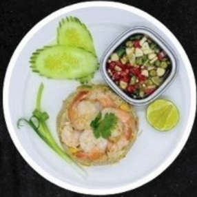
ข้าวผัดไข่/ไก่/หมู/กุ้ง Fried Rice with Egg/Chicken/Pork/Shrimp