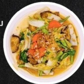
ผัดผักรวม Stir-Fried Mixed Vegetables.