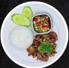
ข้าวไก่กระเทียม/หมูกระเทียม Rice with Garlic Chicken / Pork