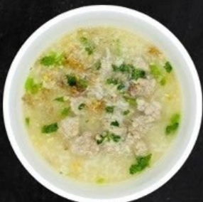
ข้าวต้มไก่/หมู/กุ้ง Boiled Rice with Chicken/ Pork/Shrimp