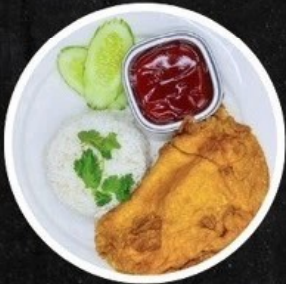
ข้าวไข่เจียว/ไข่เจียวหมูสับ Rice with Thai Omelet / Minced Pork Thai Omelet