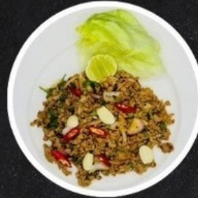
ลาบไก่/หมู Spicy Minced Chicken / Pork Salad.