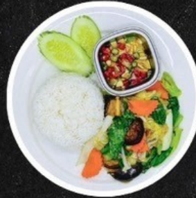
ผัดผักรวมราดข้าว Stir-Fried Mixed Vegetables.