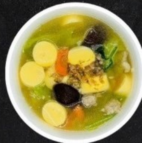
แกงจืดเต้าหู้หมูสับ Clear Soup with Tofu and Minced Pork.